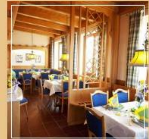
Die Gasträume und Fremdenzimmer wurden einer Verjüngungskur unterzogen.

Bei uns heißt das, dass die Eltern die Idee hatten, auf dem höchsten und schönsten Aussichtspunkt des südlichen Landkreises Passau, aus einem Bauarbeiterschuppen ein Wirtshaus zu schaffen. Mit ihrer ganzen Tatkraft gelang es ihnen, ihren Traum zu verwirklichen. Der Vater hat mir 1992 ein