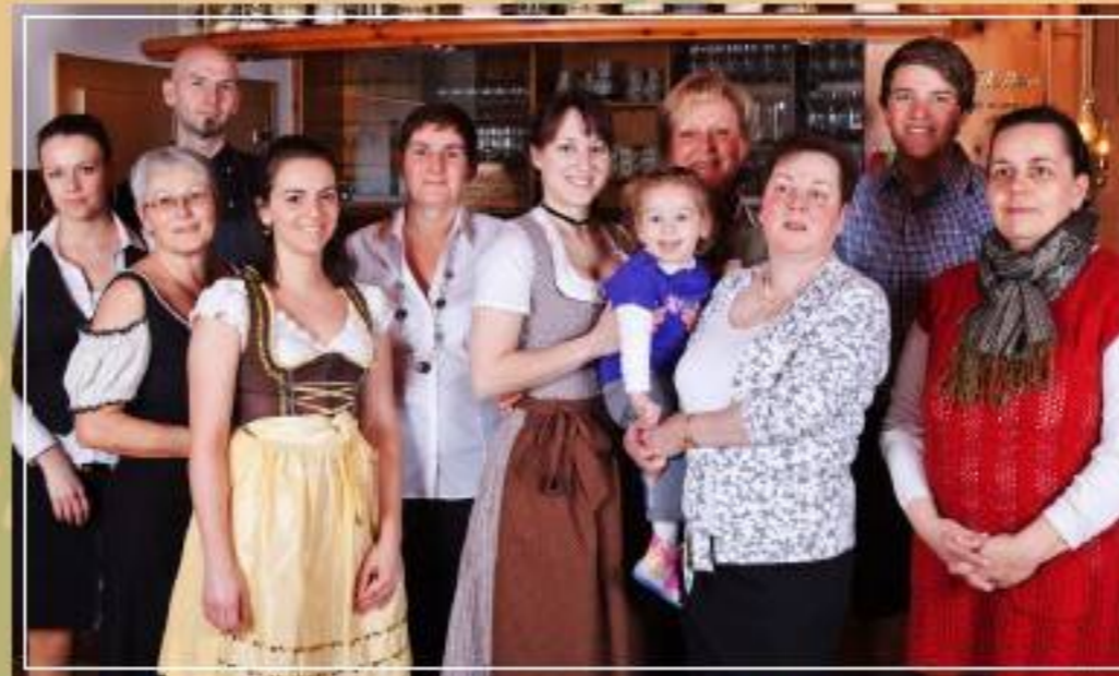
Unser Team, unterstützt von einem Meisterkoch, wird Ihnen gerne auch ausgefallene und spezielle Wünsche erfüllen.