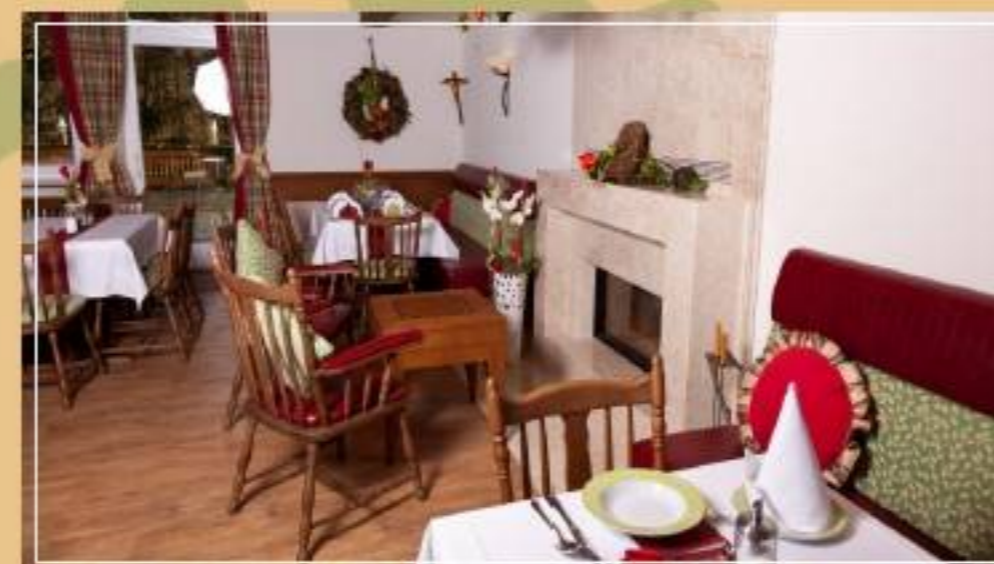
Das neue Kaminzimmer besticht durch den behaglichen Kamin, der eine sehr warme Atmosphäre ausstrahlt.

Bedanken will ich mich auch noch bei meinen sehr guten Freunden: